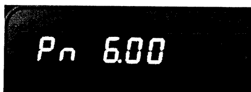
Рисунок - Идентификационный номер ПО.

Идентификация программного обеспечения осуществляется путем просмотра номера версии ПО во время прохождения теста после включения компаратора.