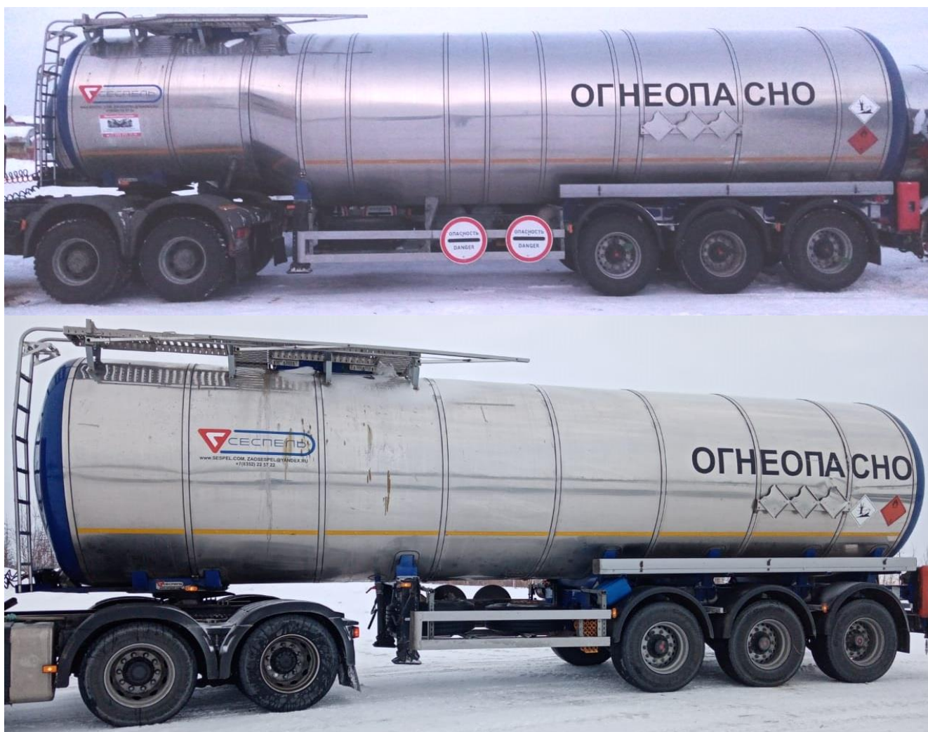
Рисунок 1 – Общий вид ППЦ

Схема пломбировки от несанкционированного изменения положения указателя уровня налива, обозначение места нанесения знака поверки представлены на рисунке 2.