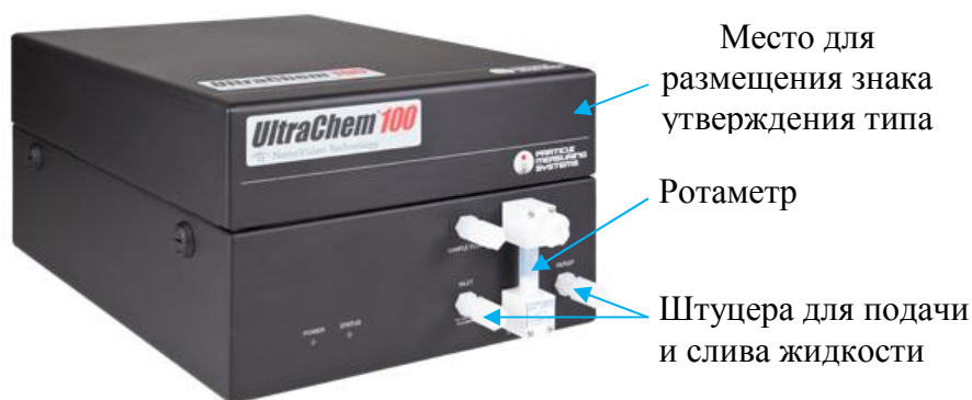
Рисунок 1 – Внешний вид счетчика UltraChem 100

Внешний вид счетчиков и обозначение места для размещения знаков утверждения типа представлены на рисунках 1 - 3. Схемы пломбировки от несанкционированного доступа счетчиков представлены на рисунках 4 - 6.