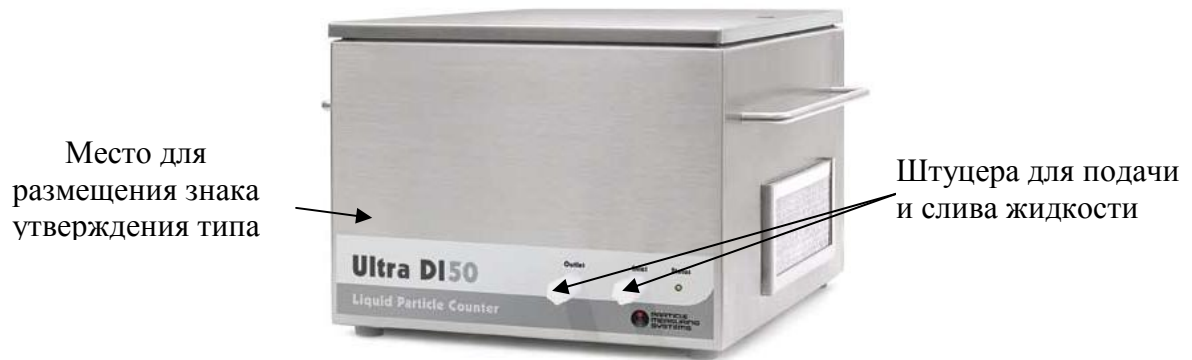
Рисунок 2 – Внешний вид счетчика Ultra DI 50