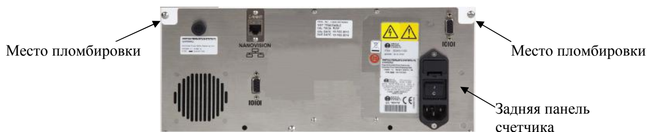
Рисунок 6 - Схема пломбировки от несанкционированного доступа счетчика SLS 1100