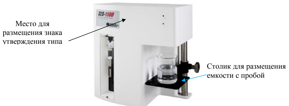
Рисунок 3 – Внешний вид счетчика SLS 1100,