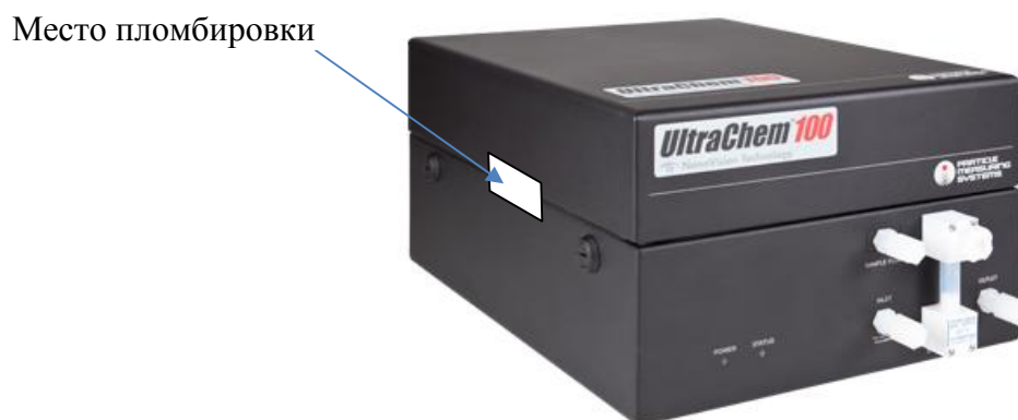
Рисунок 4 – Схема пломбировки от несанкционированного доступа счетчика UltraChem 100