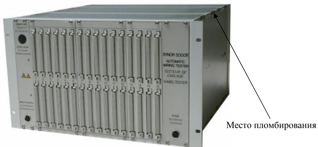
Рис. 2 – Тестер кабельный SYNOR 5000-R