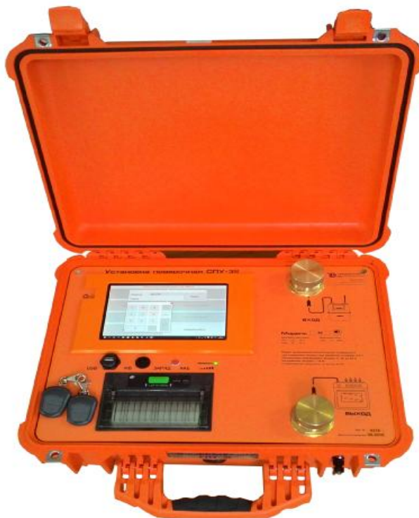
Рисунок 1– Общий вид установок поверочных СПУ-3М

Общий вид установок поверочных СПУ-3М приведен на рисунке 1.