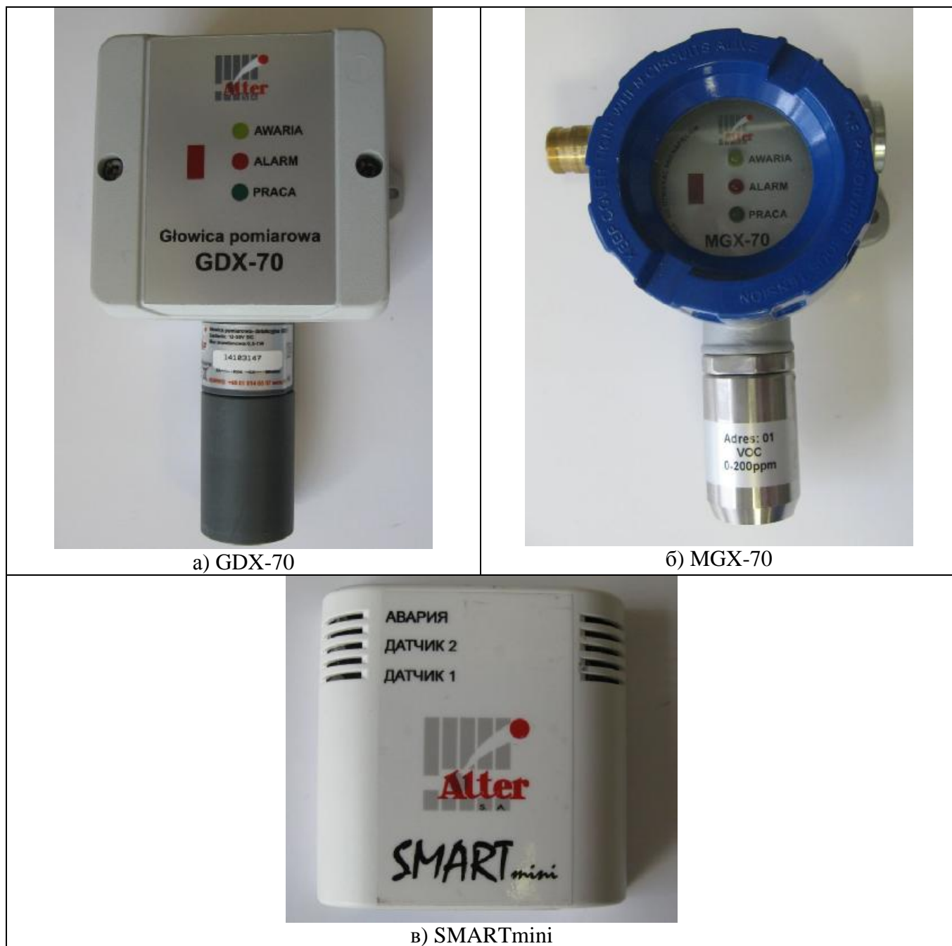
Рисунок 2 - ПИП газосигнализаторов горючих, вредных газов и кислорода многоканальных стационарных модели MSMR-16, SDO, KT-16 с датчиками MGX-70, GDX-70, SMARTmini