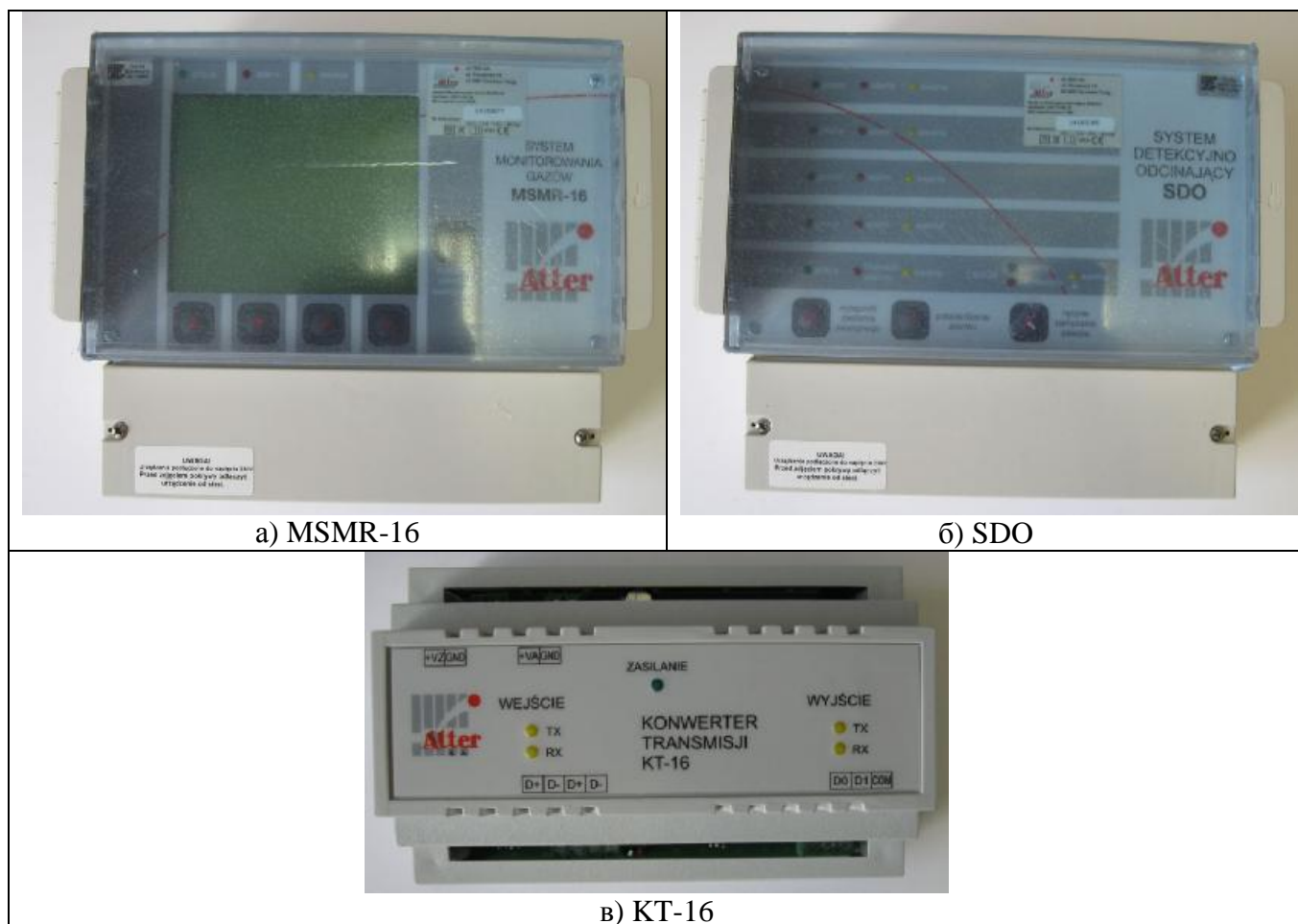
Рисунок 1 - Контроллеры газосигнализаторов горючих, вредных газов и кислорода многоканальных стационарных модели MSMR-16/SDO/KT-16 с датчиками MGX-70, GDX-70, SMARTmini

Внешний вид элементов газосигнализаторов приведен на рисунках 1 и 2. Схема пломбировки газосигнализаторов от несанкционированного доступа приведена на рисунке 4.