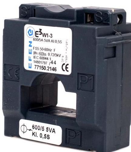
Рисунок 1 - Общий вид трансформаторов тока ЕЗW1-3

Трансформаторы относятся к не ремонтируемым и не восстанавливаемым изделиям.