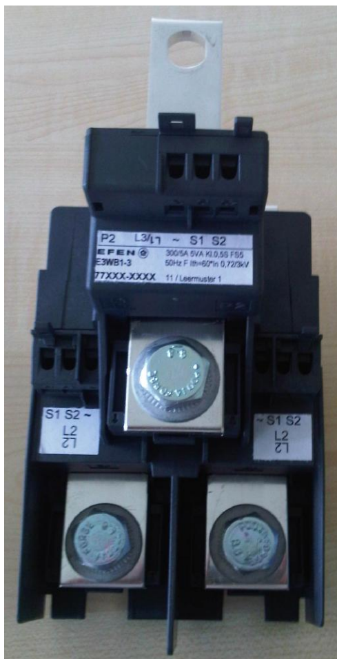
Рисунок 2 - Общий вид трансформаторов тока E3WB1-3