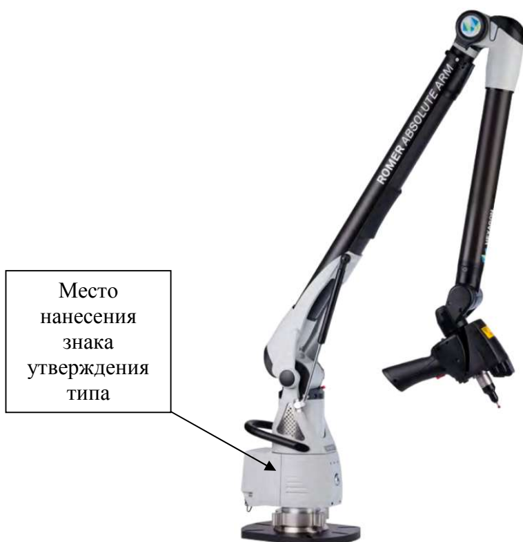
Рисунок 2 - Общий вид машины семиосевой модификации со встроенным лазерным сканером