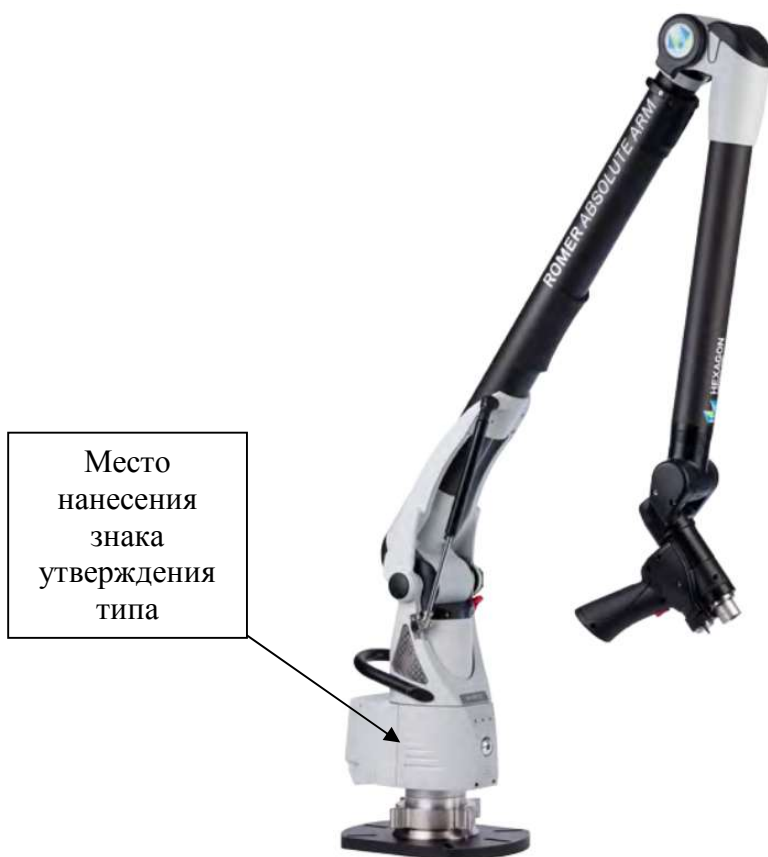
Рисунок 3 - Общий вид машины семиосевой модификации с внешним лазерным сканером