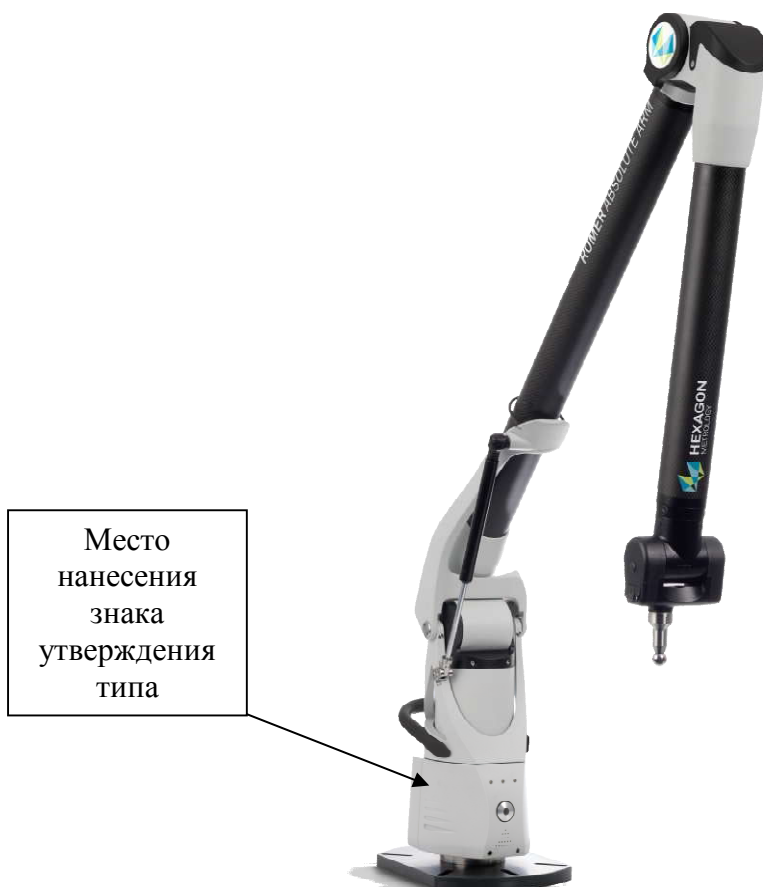
Рисунок 1 - Общий вид машины шестиосевой модификации