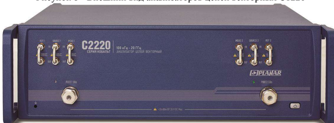
Рисунок 9 - Внешний вид анализаторов цепей векторных C2220