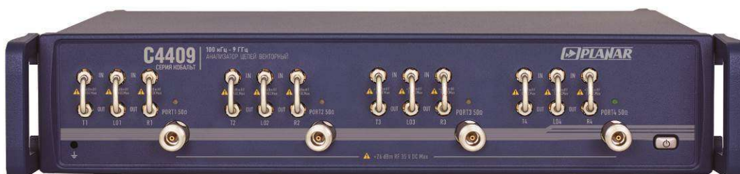
Рисунок 6 - Внешний вид анализаторов цепей векторных C4409