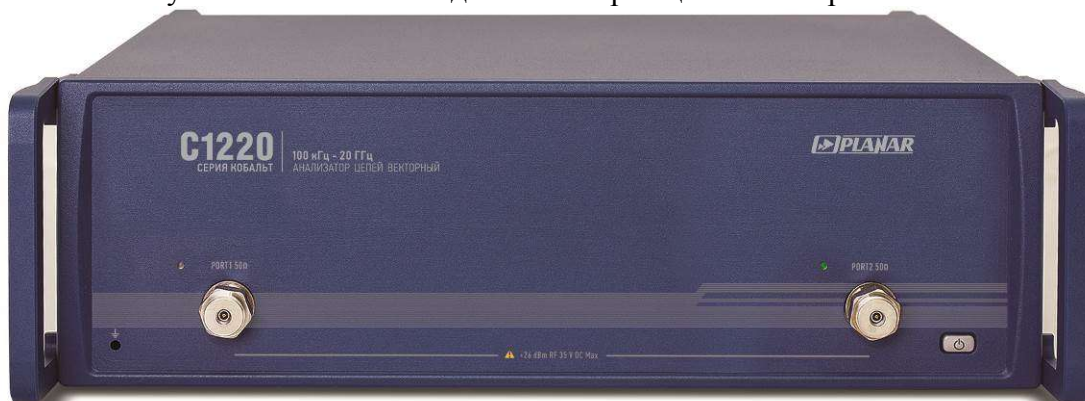
Рисунок 8 - Внешний вид анализаторов цепей векторных C1220