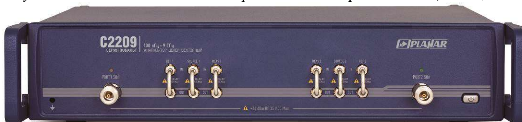
Рисунок 2 - Внешний вид анализаторов цепей векторных С2209