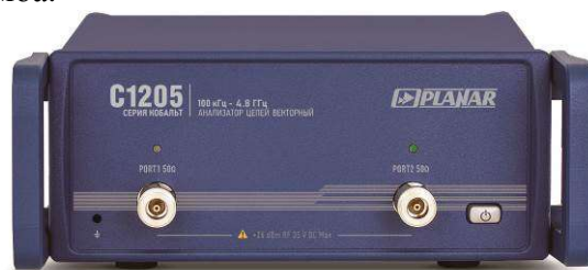
Рисунок 1 - Внешний вид анализаторов цепей векторных С1205 (С1207, С1209)

Внешний вид приведён на рисунках с 1 по 13. Маркировка включает общее для всех анализаторов цепей векторных наименование «серия Кобальт». Места для размещения наклеек приведены на рисунках 14 и 15. Место нанесения знака утверждения типа находится на наклейке, расположенной на задней панели. Функцию защиты от несанкционированного доступа выполняет гарантийная пломба.