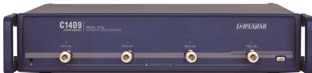
Рисунок 4 - Внешний вид анализаторов цепей векторных C1409