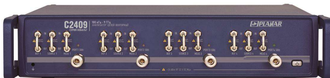
Рисунок 5 - Внешний вид анализаторов цепей векторных C2409