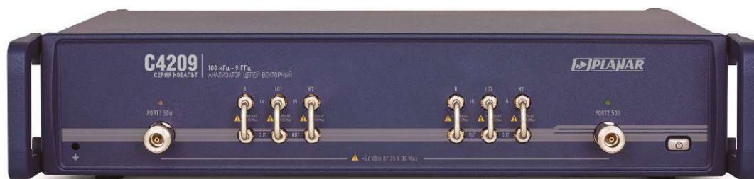
Рисунок 3 - Внешний вид анализаторов цепей векторных C4209