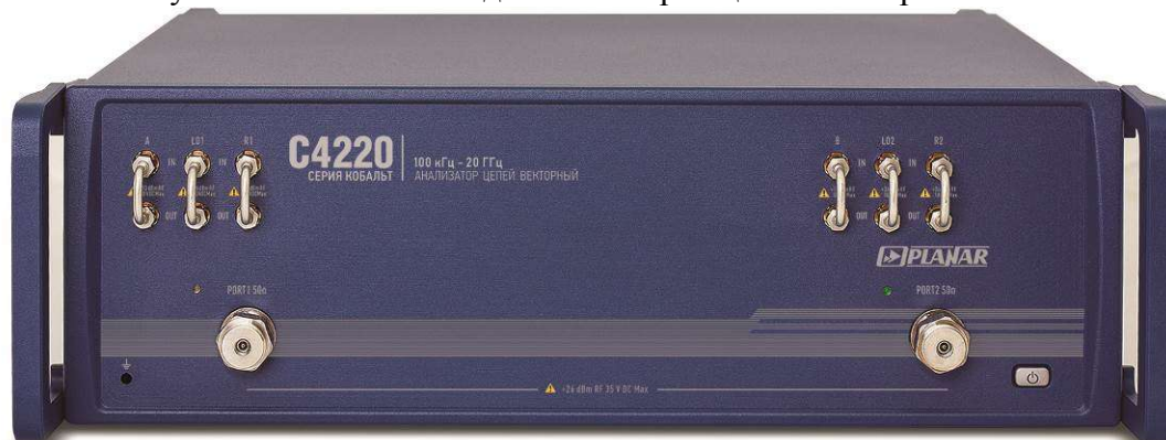
Рисунок 10 - Внешний вид анализаторов цепей векторных C4220