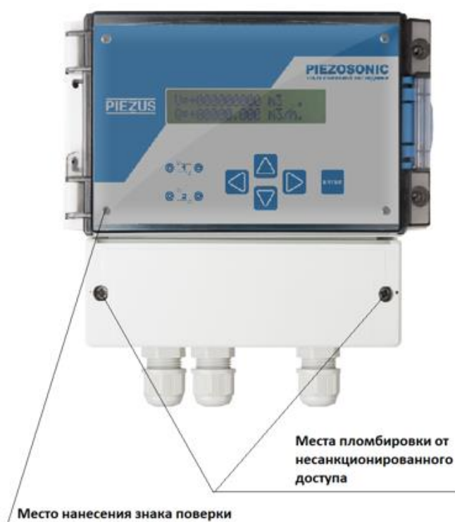
Рисунок 3 – Схема пломбировки от несанкционированного доступа и обозначение места нанесения знака поверки

прямым ИУ по двухлучевой схеме с расположением акустических каналов на перекрещенных хордах