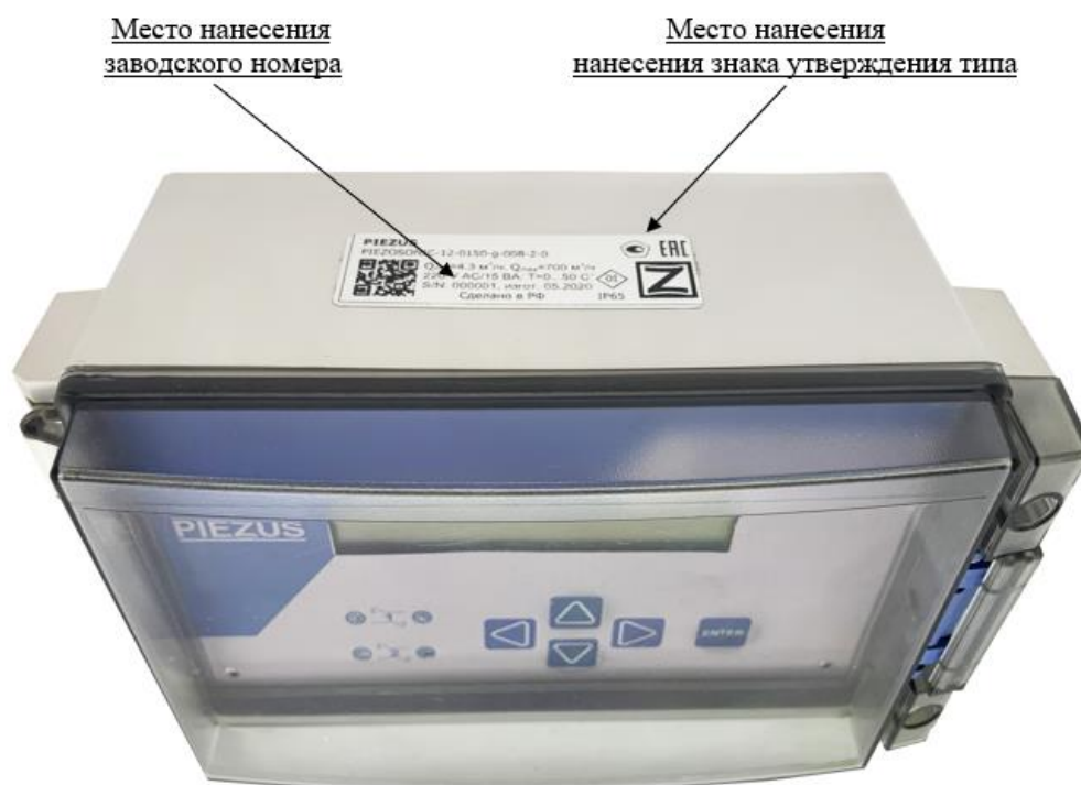
Рисунок 4 – Места нанесения заводского номера и знака утверждения типа