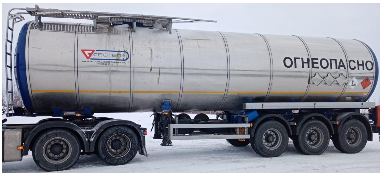
Рисунок 1 – Общий вид ППЦ