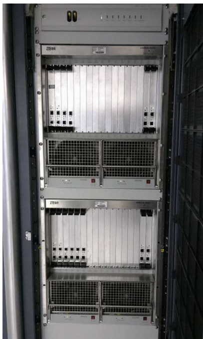
Рисунок 1 - Общий вид оборудования с открытой дверью

На рисунке 2 изображено место блокирования кассетного модуля (блокируется возможность бесконтрольной выемки кассет).