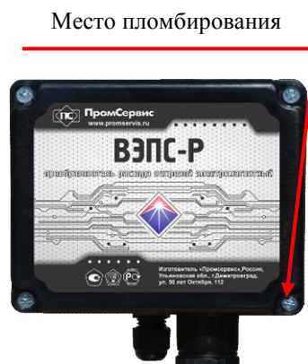
Рисунок 3 - Пломбирование ПР ВЭПС-Р