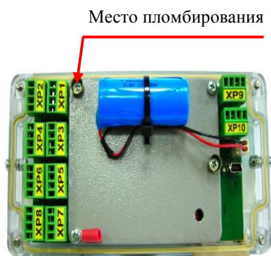
Рисунок 2 - Пломбирование вычислителя

В целях предотвращения несанкционированного доступа к узлам регулировки, настройки и программному обеспечению (ПО), составные части теплосчетчиков пломбируются. Места пломбирования основных составных частей теплосчетчиков приведены на рисунках 2 - 4.