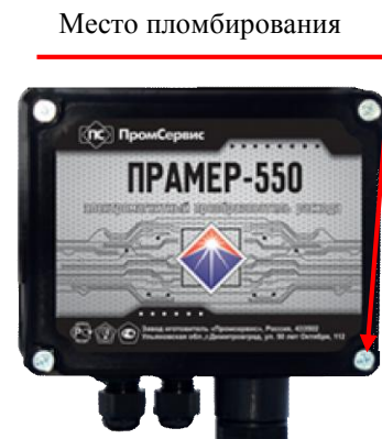
Рисунок 4 - Пломбирование ПР ЭМИР-ПРАМЕР-550