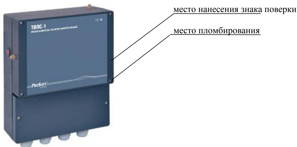
Рисунок 1 - Общий вид ТВПС-1 (в базовом исполнении)

Внешний вид ТВПС-1, места пломбировки и нанесения знака поверки представлены на рисунках 1 и 2.