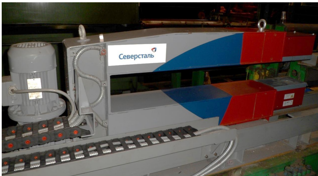
Рисунок 1 - Общий вид толщиномера

Общий вид толщиномера представлен на рисунке 1.