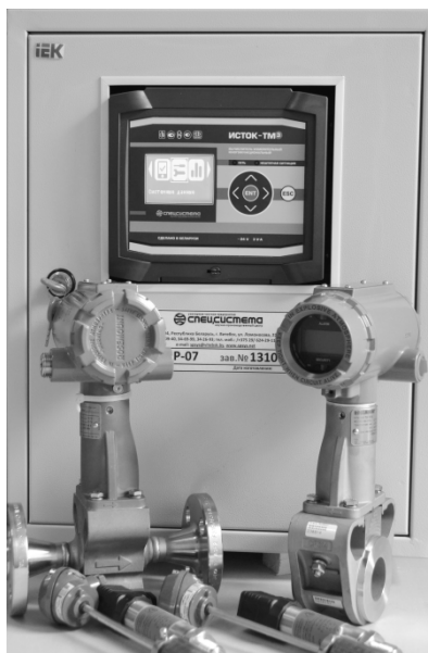
Рисунок 2 - Внешний вид СИ ИСТОК на базе вычислителя ИСТОК-ТМ3