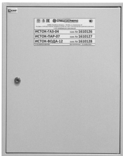
Рисунок 3 - Внешний вид расширителя ИСТОК-ТМр