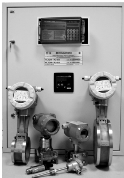
Рисунок 1 - Внешний вид СИ ИСТОК на базе вычислителя ИСТОК-ТМ

Места нанесения знака поверки в виде клейма-наклейки на составные части и монтажный шкаф СИ ИСТОК, а также место пломбировки монтажного шкафа СИ ИСТОК от несанкционированного доступа представлены на рисунке 4 на примере комплекта поставки СИ ИСТОК-ГАЗ-03.