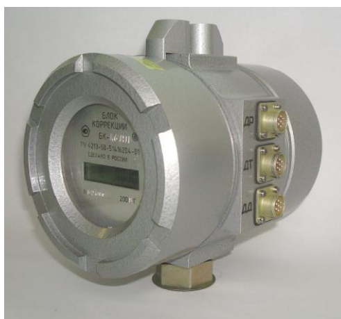
Рисунок 1 – Общий вид блока коррекции объема газа измерительно-вычислительного БК

Блоки выпускаются в двух исполнениях I и II различающихся диапазоном измерений и характеристиками погрешности по каналом измерения температуры и давления.