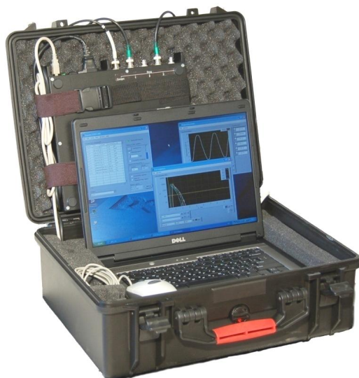
Рисунок 1 - Общий вид ИЧР «КОРОНА-20»