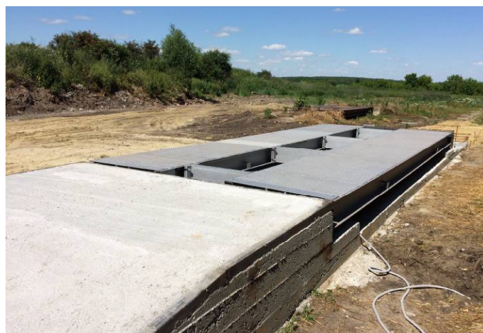
Рисунок 1 - Общий вид ГПУ весов