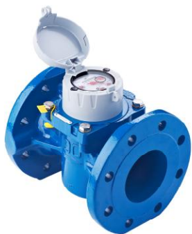
Рисунок 3 - Общий вид счетчика WP