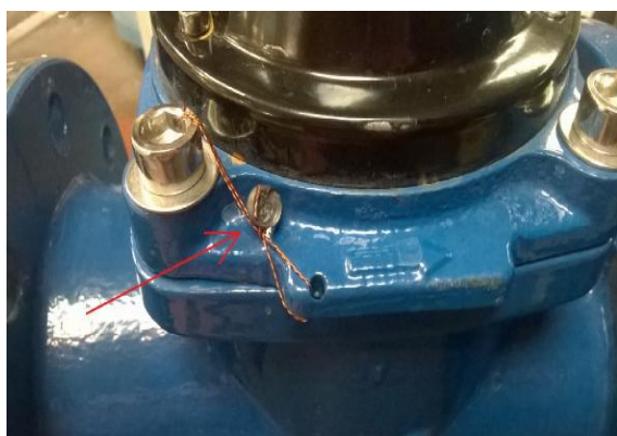
Рисунок 5 - Схема пломбировки WMAP