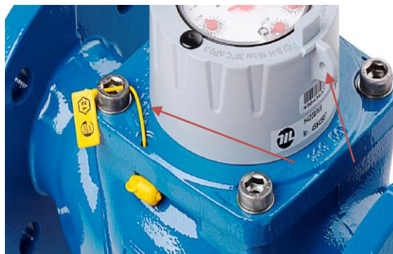
Рисунок 8 - Схема пломбировки WS