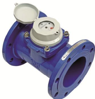
Рисунок 1 - Общий вид счетчика WMAP

Схема пломбировки от несанкционированного доступа, обозначение места нанесения знака поверки представлены на рисунке 5, 6, 7, 8.