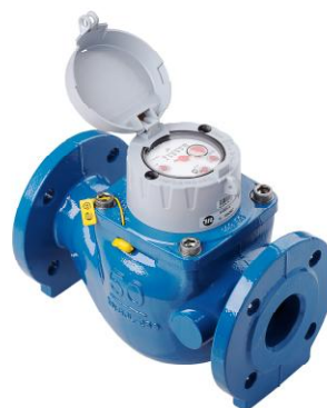
Рисунок 2 - Общий вид счетчика WS