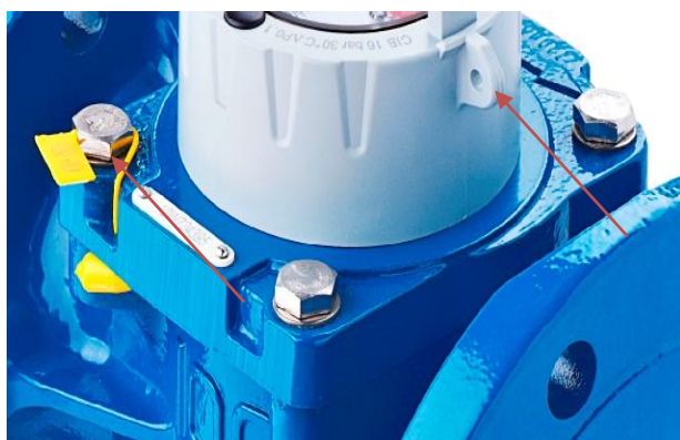
Рисунок 6 - Схема пломбировки WP