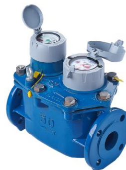
Рисунок 4 - Общий вид счетчика WPV