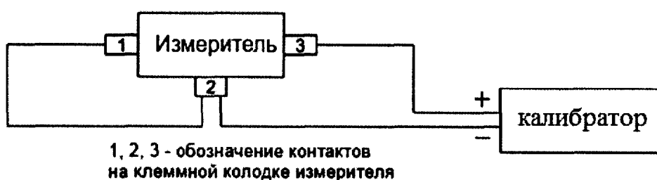
Рисунок 1 – Схема подключения