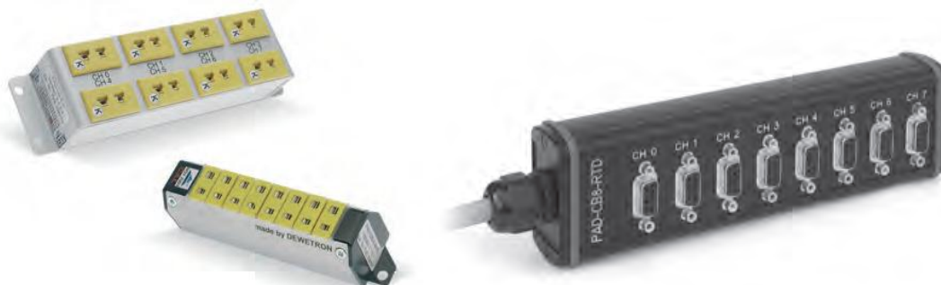
Рисунок 5 - Внешний вид модулей PAD-CB8

Пломбирование комплексов программно-технических DEWE2 не предусмотрено.