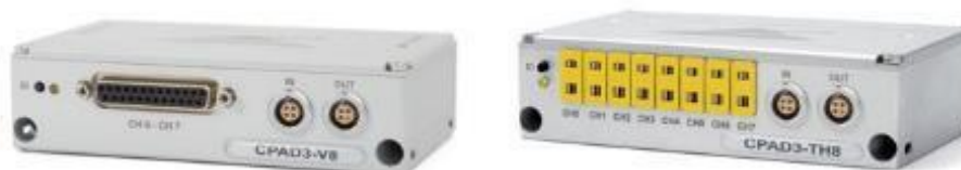
Рисунок 4 - Внешний вид модулей xPAD