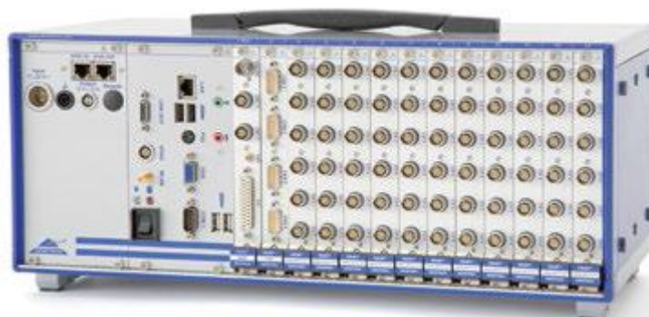
Рисунок 1 - Внешний вид комплексов в исполнении базового блока