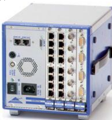
Рисунок 3 - Внешний вид комплексов в исполнении блока расширения