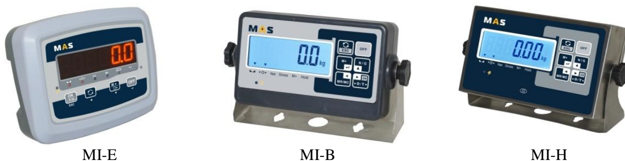
Рисунок 2 - Общий вид индикаторов