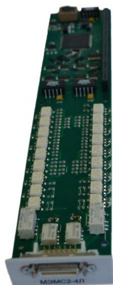
Рисунок 1 - Общий вид МЭМС2-4Л

Общий вид электронного магазина сопротивления постоянному току МЭМС2-4Л представлен на рисунке 1. Внешний вид носителя мезонинов с установленным мезонином и схема пломбировки от несанкционированного доступа приведены на рисунке 2.