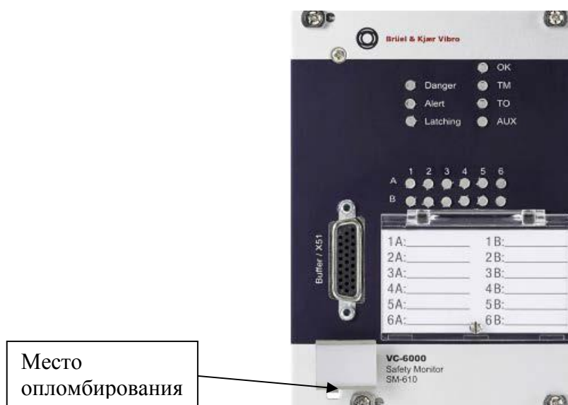
Рисунок 2 - Идентификационная табличка аппаратуры измерения параметров вибрации многоканальная VC-6000