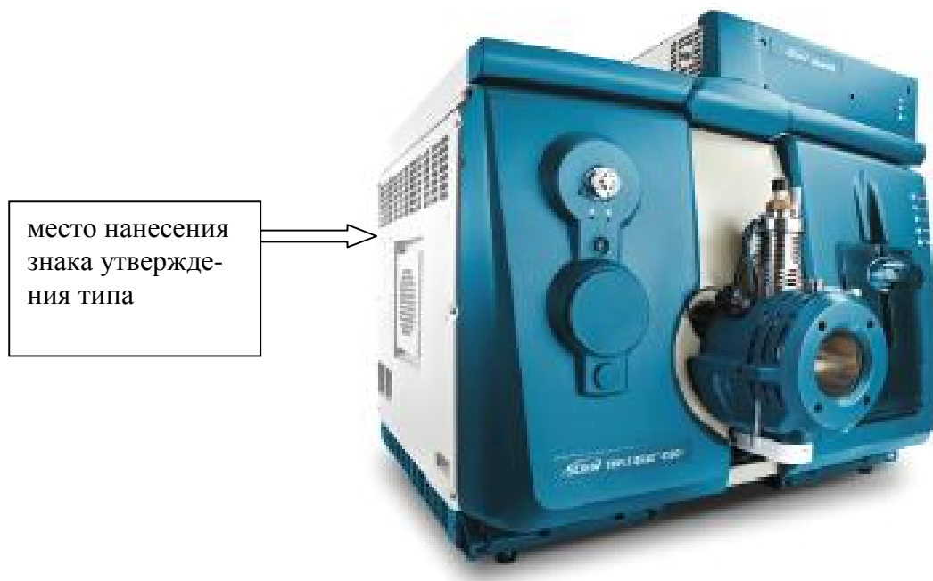
Рисунок 1 - Общий вид масс-спектрометра Triple Quad 6500+ и обозначение места нанесения знака утверждения типа