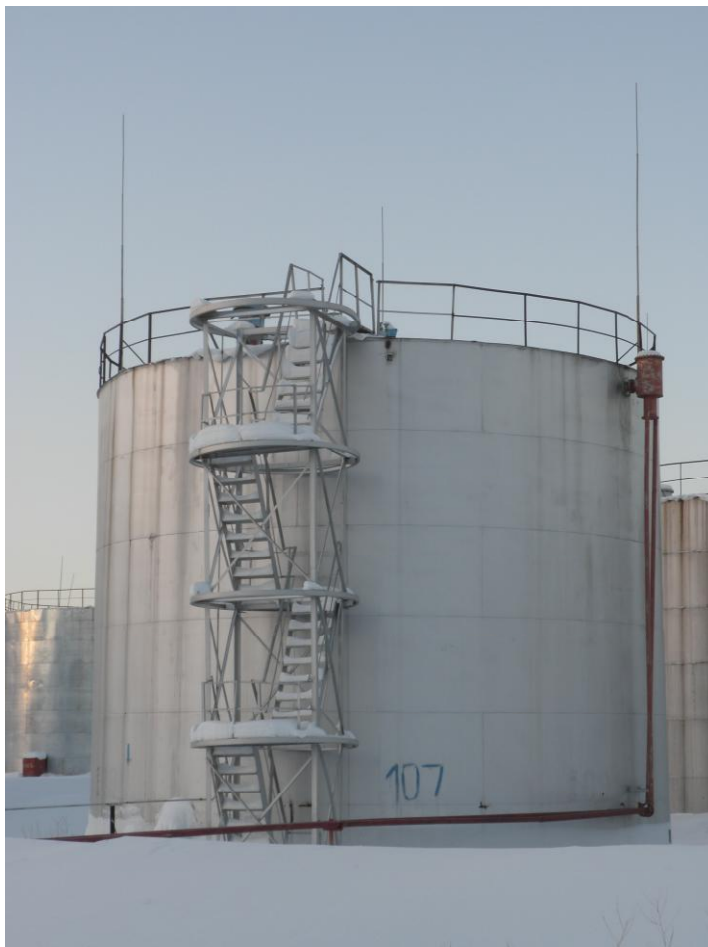
Рисунок 1 - Общий вид резервуара РВС-700