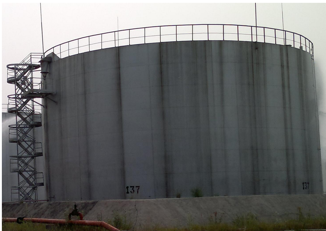
Рисунок 5 - Общий вид резервуара РВС-5000