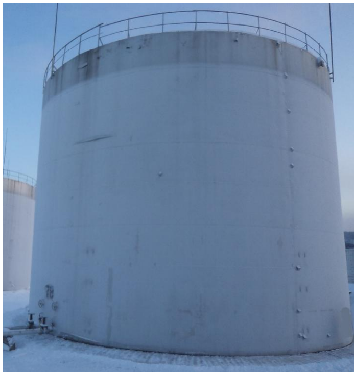
Рисунок 3 - Общий вид резервуара РВС-2000