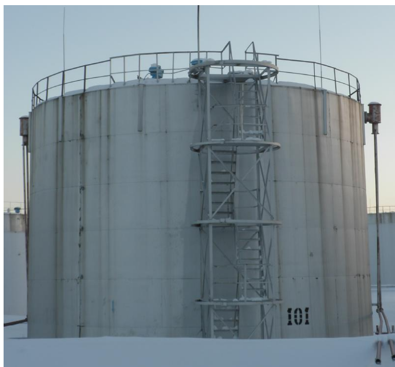
Рисунок 2 - Общий вид резервуара РВС-1000