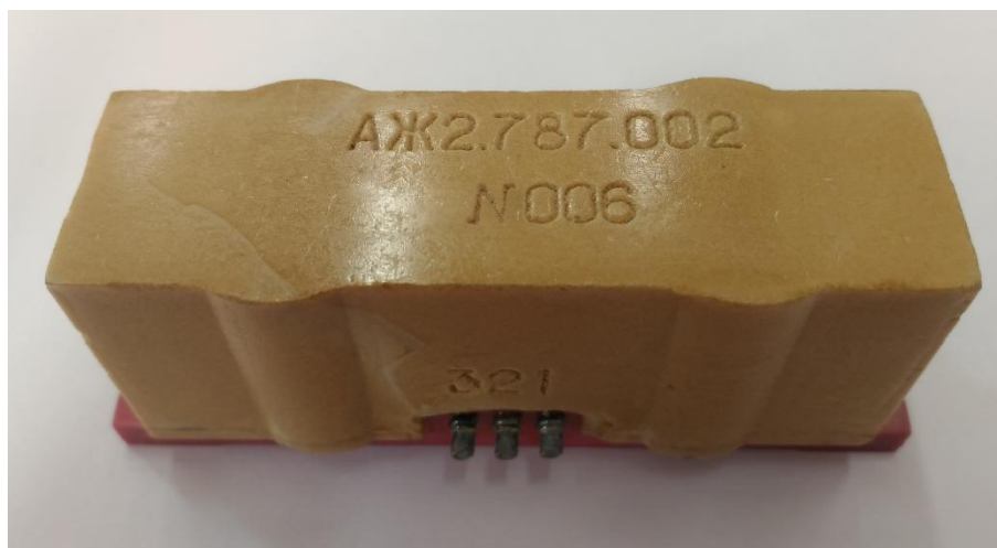
Рисунок 1 - Внешний вид датчика

Датчик выполнен в неразъемной конструкции. Несанкционированный доступ к элементам датчика невозможен.