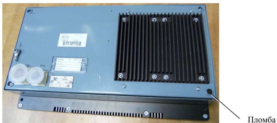
Рисунок 8 - Схема пломбировки от несанкционированного доступа БИЛ-М