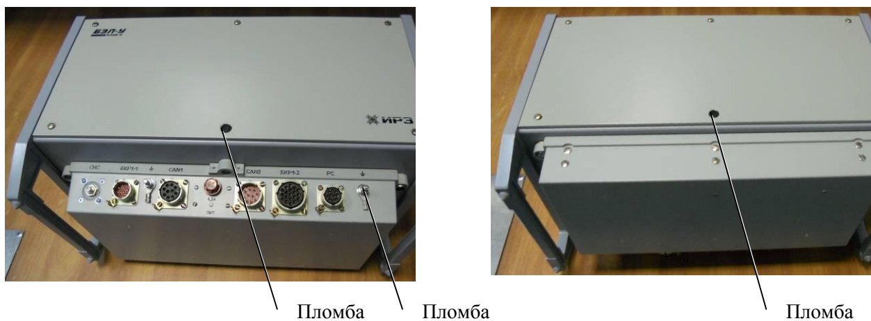
Рисунок 2 - Схема пломбировки от несанкционированного доступа БЭЛ-У