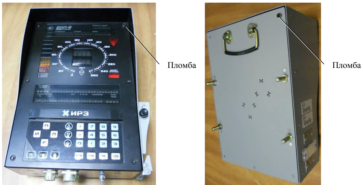
Рисунок 7 - Схема пломбировки от несанкционированного доступа БИЛ-В