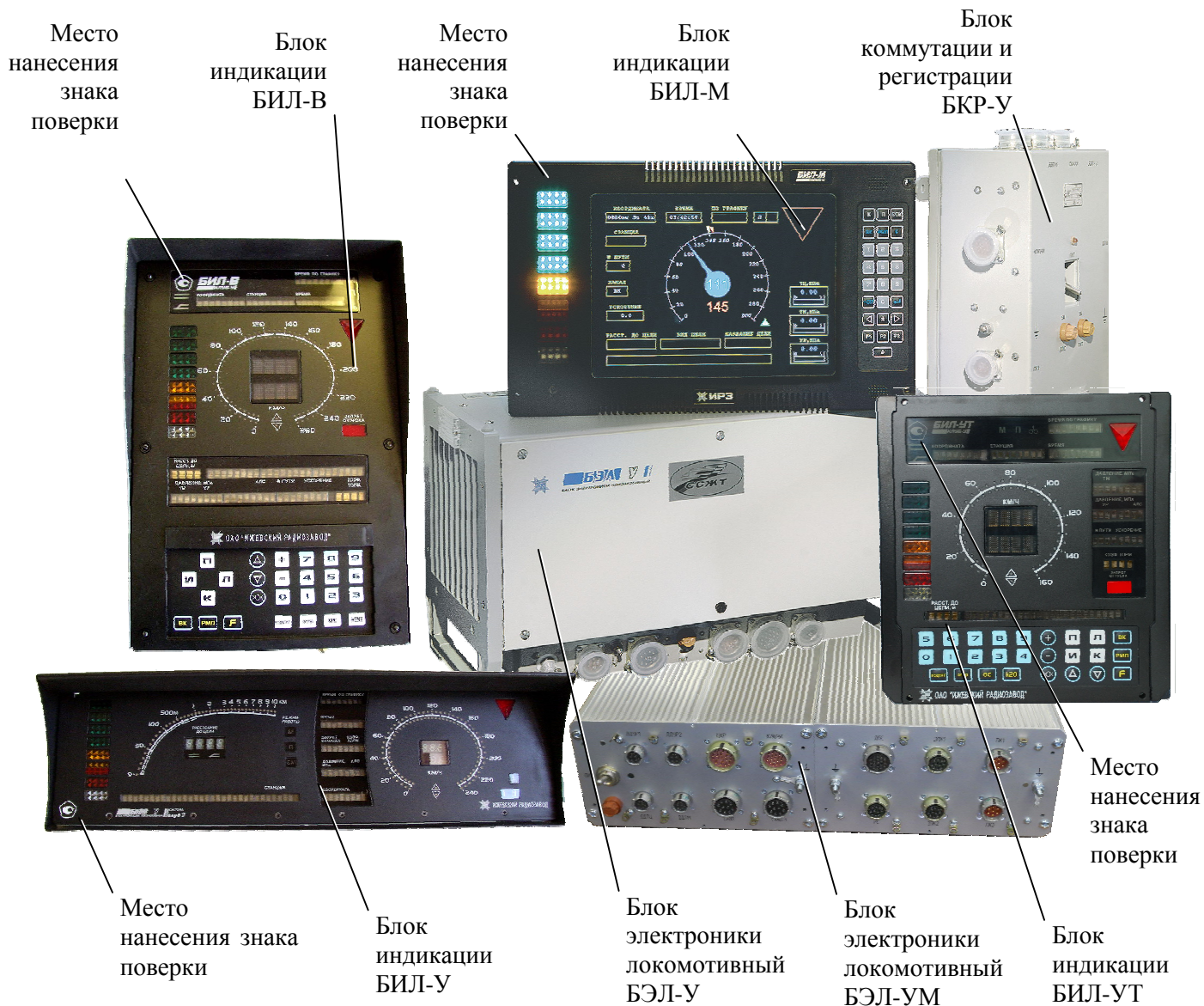
Рисунок 1 - Общий вид каналов измерительных скорости и давления из состава устройства безопасности комплексного локомотивного унифицированного КЛУБ-У и место нанесения знака поверки