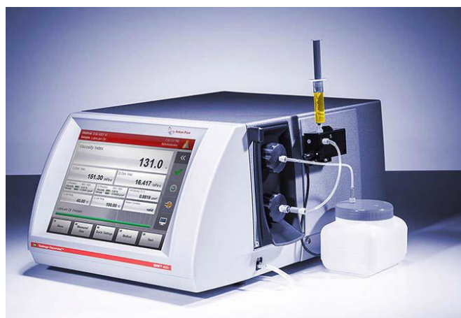
Рисунок 2- Общий вид вискозиметра SVM 4001