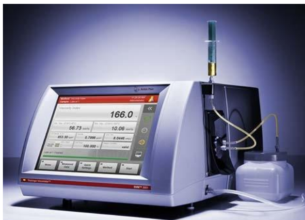
Рисунок 1- Общий вид вискозиметров SVM 2001и SVM 3001

Схема пломбировки от несанкционированного доступа представлена на рисунке 3.