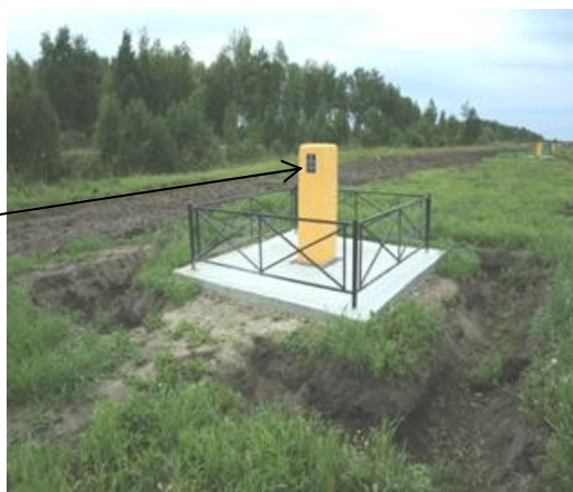
Рисунок 2 - Внешний вид пункта № 1

Пломбирование Полигона не предусмотрено.