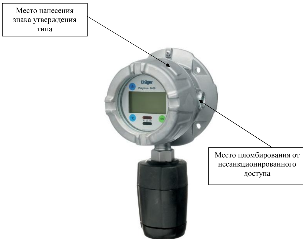
Рисунок 1 - Внешний вид датчиков газов Dräger модель Dräger Polytron 8000/8100

Внешний вид датчиков, места пломбировки от несанкционированного доступа и место нанесения знака утверждения типа представлены на рисунках 1 - 2.