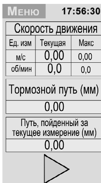
Рисунок 2 - Общий вид графического индикатора электронного блока