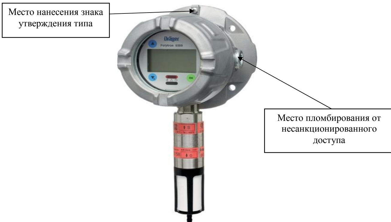
Рисунок 1 - Внешний вид датчика газов Dräger модели Dräger Polytron 8310

Внешний вид датчиков, места пломбировки от несанкционированного доступа и место нанесения знака утверждения типа представлены на рисунках 1 - 3.