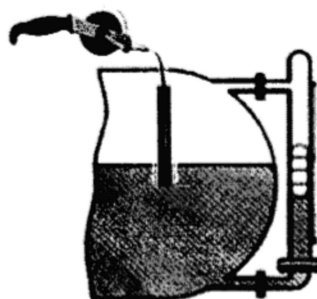
Рисунок 2 – Проверка уровнемера без демонтажа с помощью эталонной рулетки с лотом