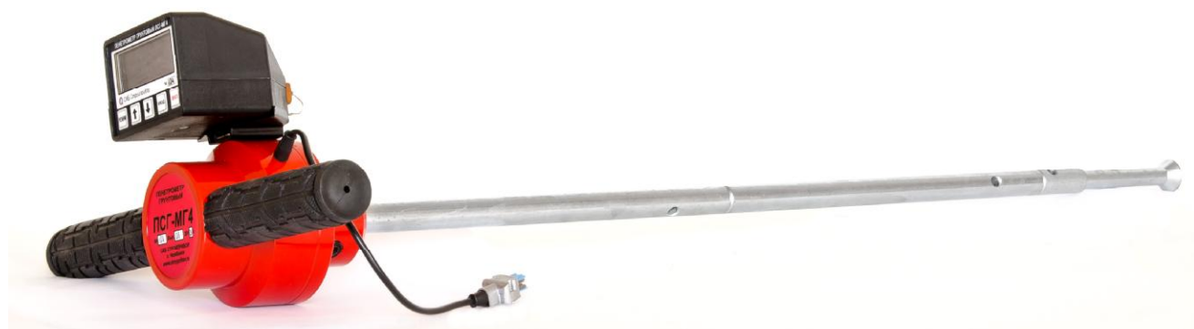
Рисунок 1 – Общий вид пенетрометра грунтового ПСГ-МГ4

Схема пломбировки от несанкционированного доступа представлена на рисунке 2.