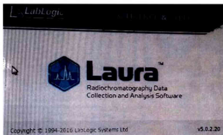
Рис.1 Отображения версии исполняемых файлов

7.2.2.3 Для определения версии файла необходимо в диалоговом окне активировать в меню вкладку Help, затем вкладку Info. В открывшемся окне будут отображены наименование и версия программы (рис.1). Отображенный номер версии должен быть не ниже указанного в описании типа.