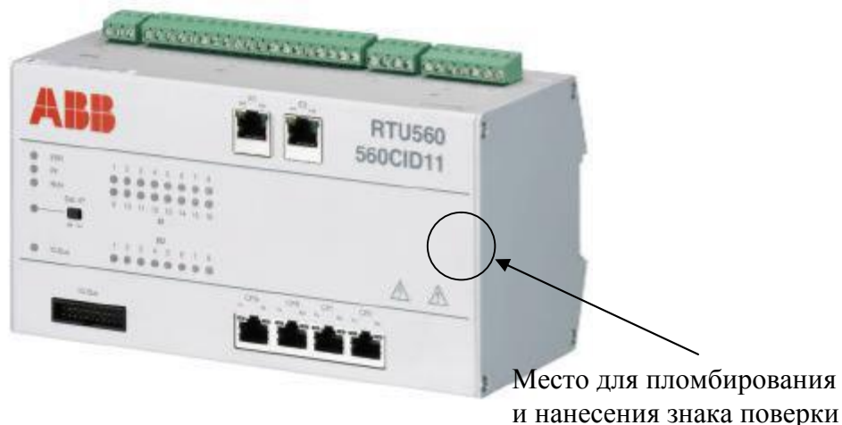
Рисунок 2 – Внешний вид модуля 560CID11