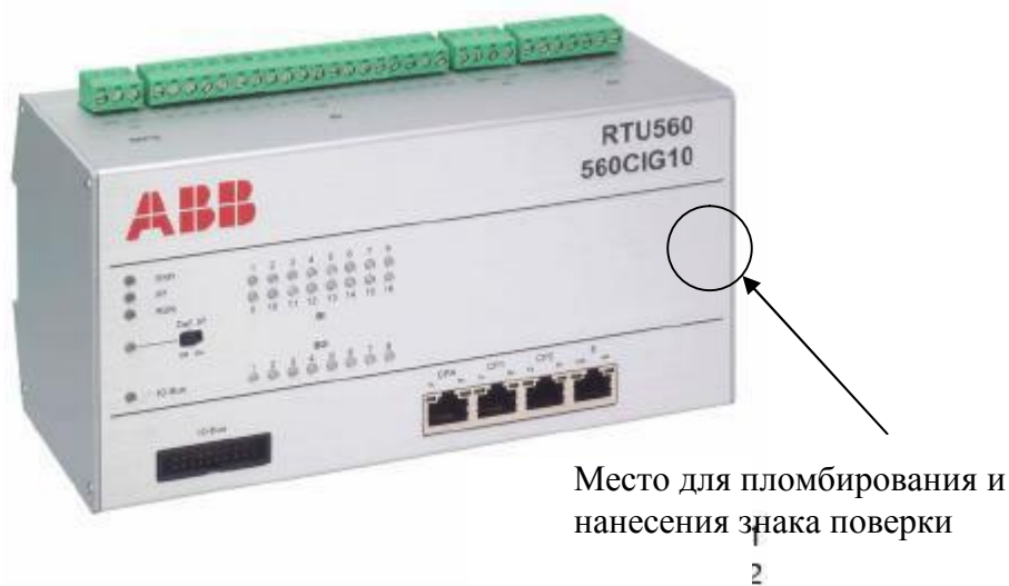
Рисунок 1 – Внешний вид модуля 560CIG10

Внешний вид устройств с указанием мест пломбирования и нанесения знака поверки представлен на рисунках 1-3.