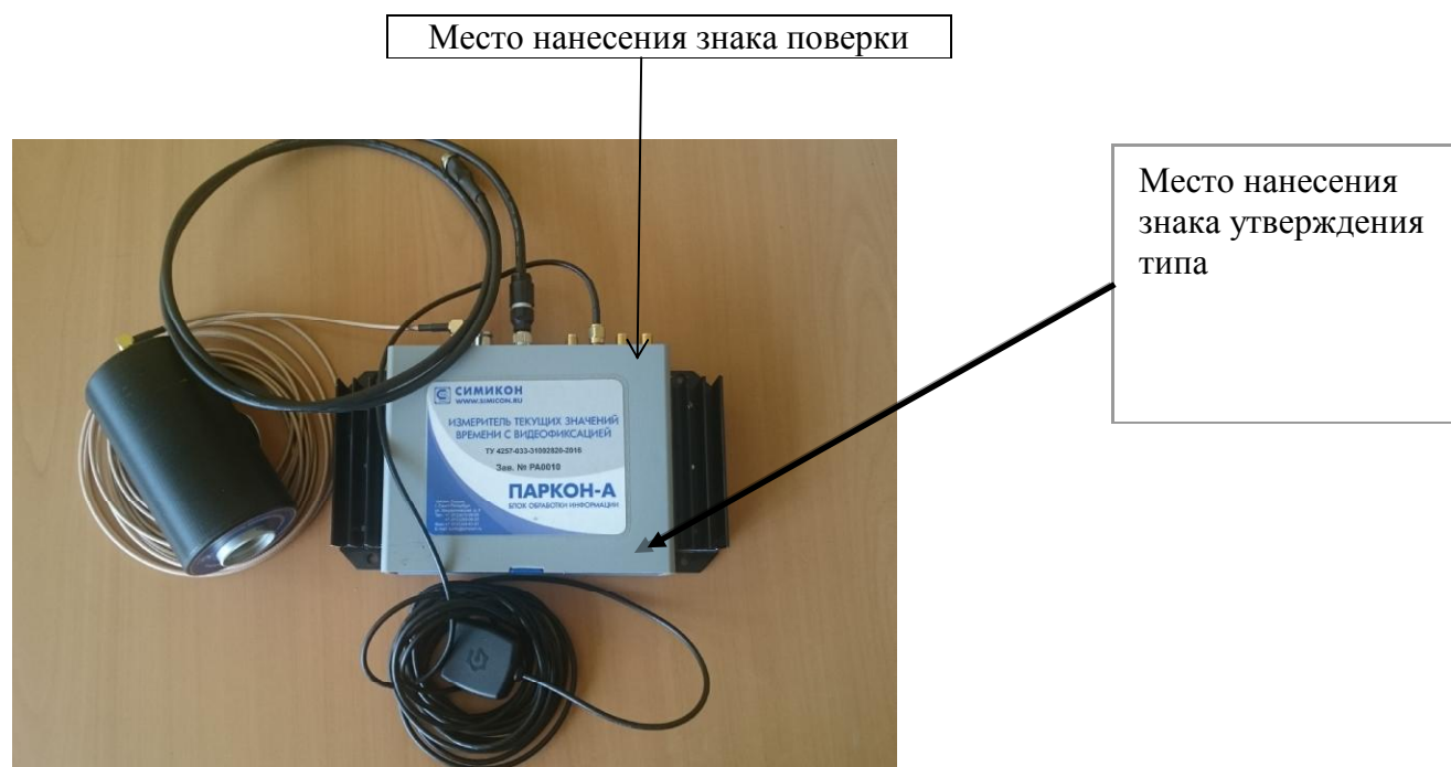
Рисунок 1 - Общий вид комплексов

Общий вид комплексов с указанием места размещения знака утверждения типа представлен на рисунке 1. Место пломбировки от несанкционированного доступа представлено на рисунке 2.