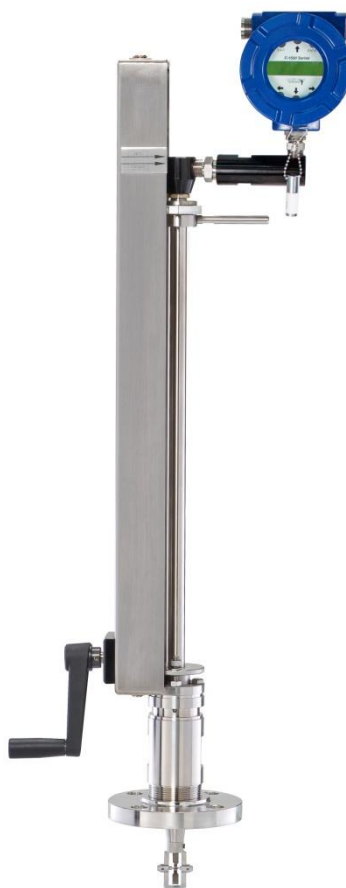
Рисунок 1 - Общий вид расходомеров-счетчиков турбинных погружных F-1500

Общий вид расходомеров-счетчиков представлен на рисунке 1.