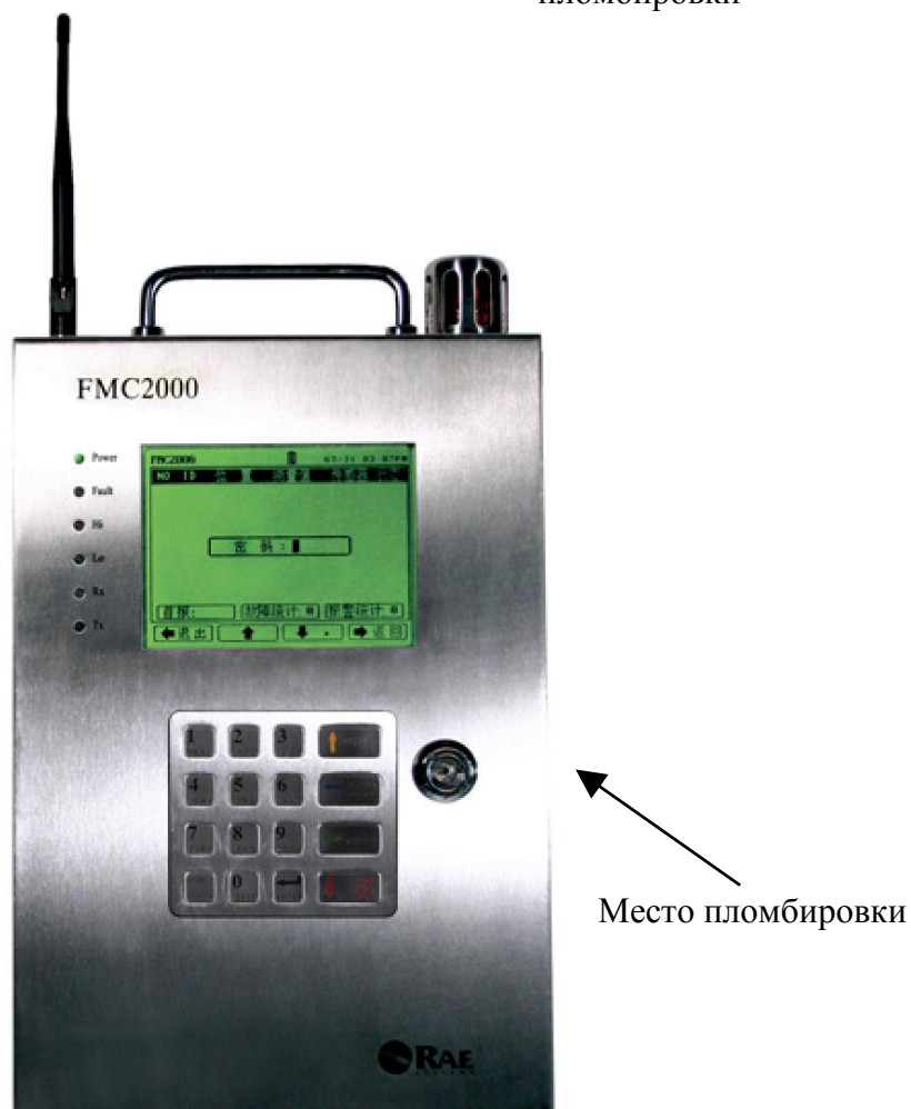
Рисунок 5 - Общий вид контроллера FMC2000 с указанием места пломбировки