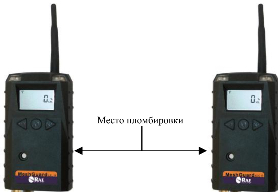
Рисунок 3 - Общий вид газоанализатора Meshguard LEL IR с указанием места пломбировки