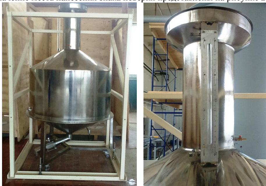
Рисунок 1 – Общий вид мерников металлических эталонных 1-го разряда JLQ-1000

Пломбирование мерников металлических эталонных 1-го разряда JLQ-1000 осуществляется нанесением знака поверки давлением на свинцовые пломбы, установленные на проволоках, пропущенных через отверстия в сливном кране, кране для регулировки жидкости на горловине и на винте регулировки шкалы. Схема пломбировки от несанкционированного доступа, обозначение места нанесения знака поверки представлены на рисунке 2.