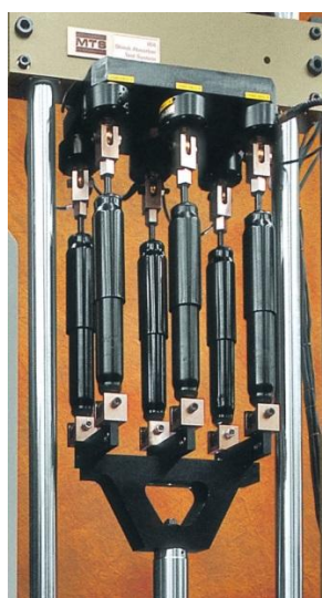
Рисунок 2 - Вид оснастки машины с 6-ю датчиками силы