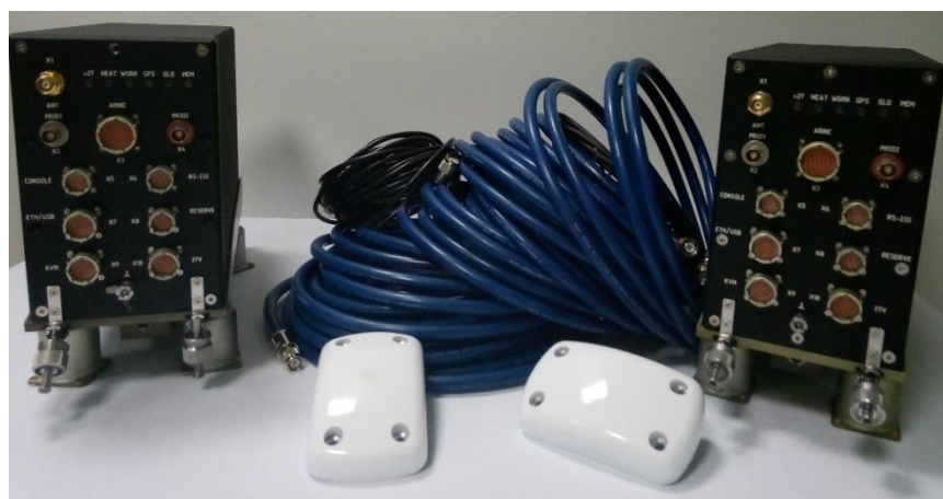
Рисунок 6 - Внешний вид измерителя координат модернизированного ИК-м1 КЕДП.466961.003