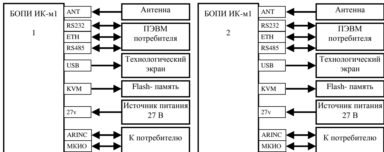
Рисунок 2 - Функциональная схема измерителя координат модернизированного ИК-м1 КЕДП.466961.003