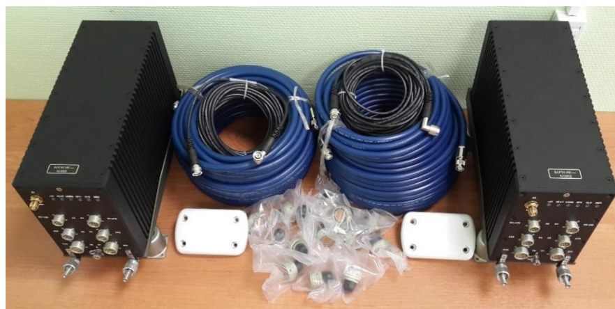
Рисунок 4 - Внешний вид измерителя координат модернизированного ИК-м