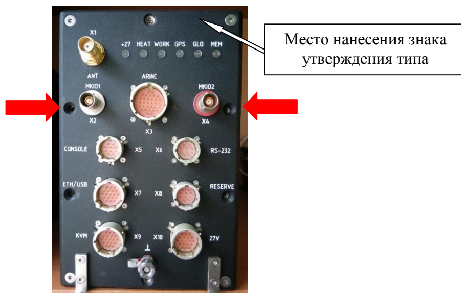
Рисунок 5 - Внешний вид лицевой панели измерителя координат модернизированного ИК-м1 КЕДП.466961.003