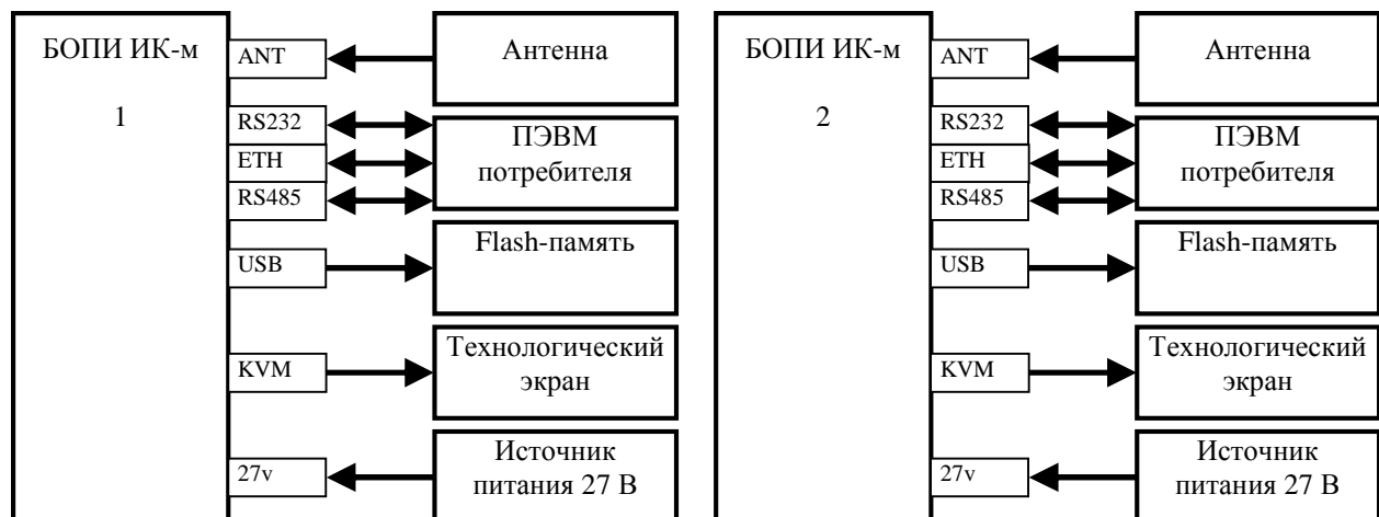
Рисунок 1 - Функциональная схема измерителя координат модернизированного ИК-м

Функциональная схема измерителя координат модернизированного ИК-м представлена на рисунке 1, измерителя координат модернизированного ИК-м1 КЕДП.466961.003 - на рисунке 2.