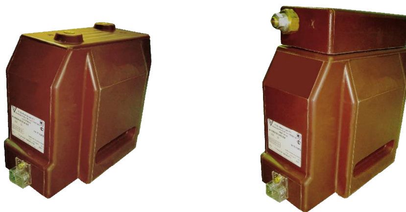
Рисунок 1 - Общий вид трансформаторов напряжения внутренней установки

Расшифровка условного обозначения трансформаторов напряжения приведена на рисунке 3.