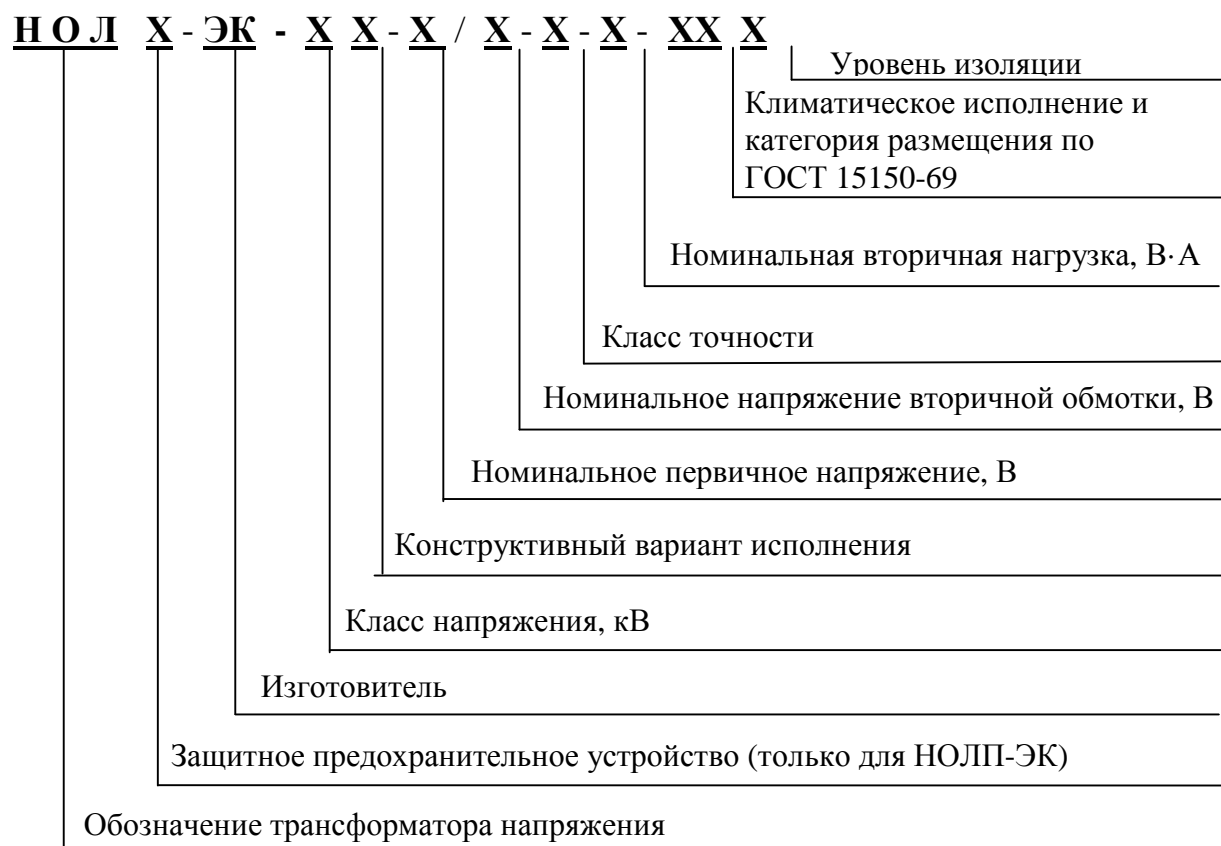
Рисунок 3 - Расшифровка условного обозначения трансформаторов напряжения