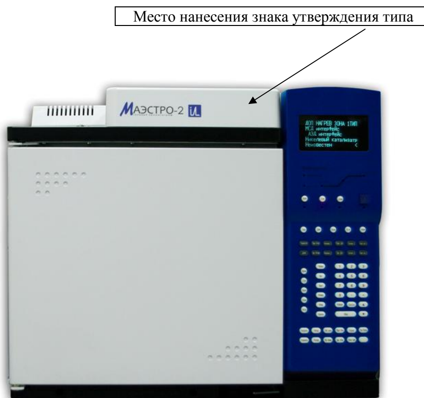
Рисунок 1 - Внешний вид хроматографов (вид спереди)