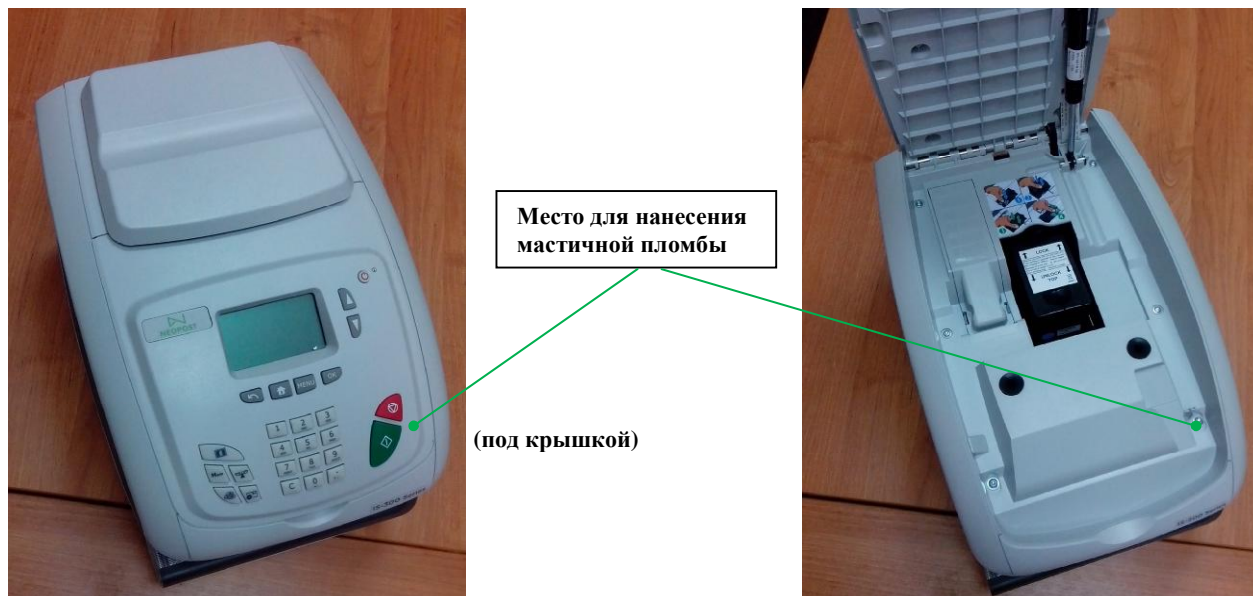
Рисунок 2 - Схема пломбировки от несанкционированного доступа