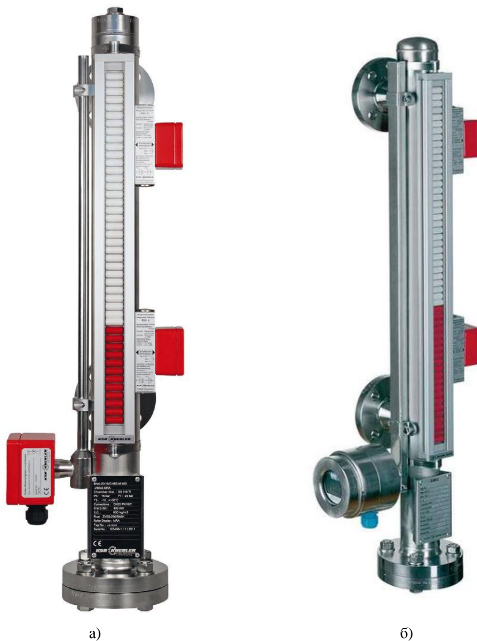
Рисунок 1 - Общий вид уровнемеров поплавковых байпасных УПБ 1015 а) без показывающего устройства; б) с показывающим устройством

На винт фиксирующий крышку измерительного преобразователя прямоугольной формы, либо фиксирующий металлическую скобу на измерительном преобразователе цилиндрической формы наносят краску или мастику. Схема пломбировки от несанкционированного доступа, обозначение мест нанесения знака поверки представлены на рисунке 2.