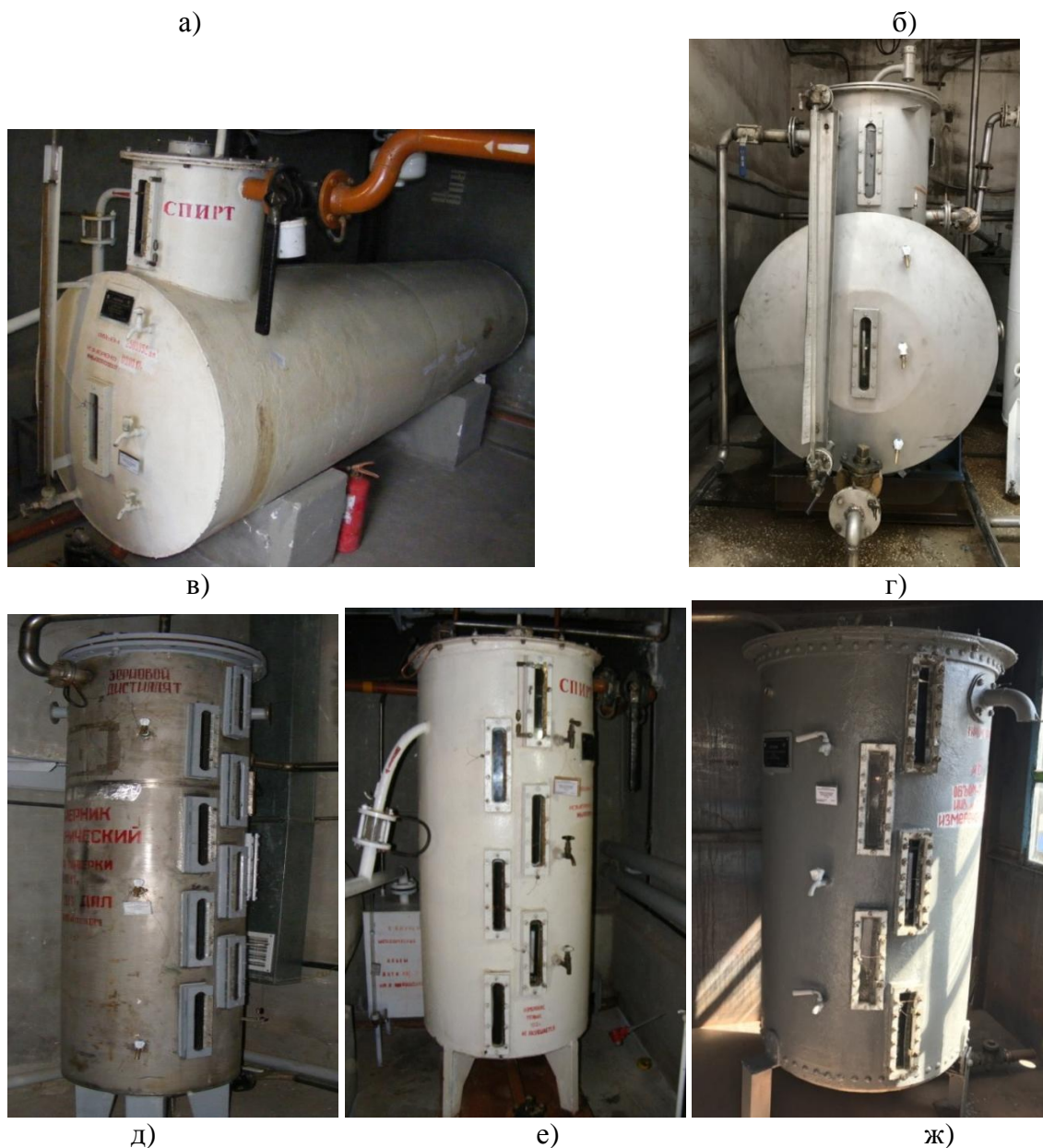
Рисунок 1– Общий вид мерников а) Г4-ВИЦ № 2846, б) Г4-ВИЦ № 1821, в) Г4-ВИЦ № 1816, г) Г4-ВИЦ № 2848, д) К7-ВМА № 96, е) К7-ВМА №73, ж) К7-ВМА № 74 Схема пломбировки от несанкционированного доступа, обозначение места нанесения знака поверки представлены на рисунке 2.