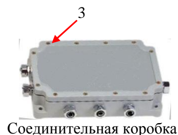
Рисунок 3 - Схемы пломбировки (где 1 - пломба в виде разрушаемой наклейки, 2 - свинцовая или пластиковая пломба, 3 - мастичная пломба).