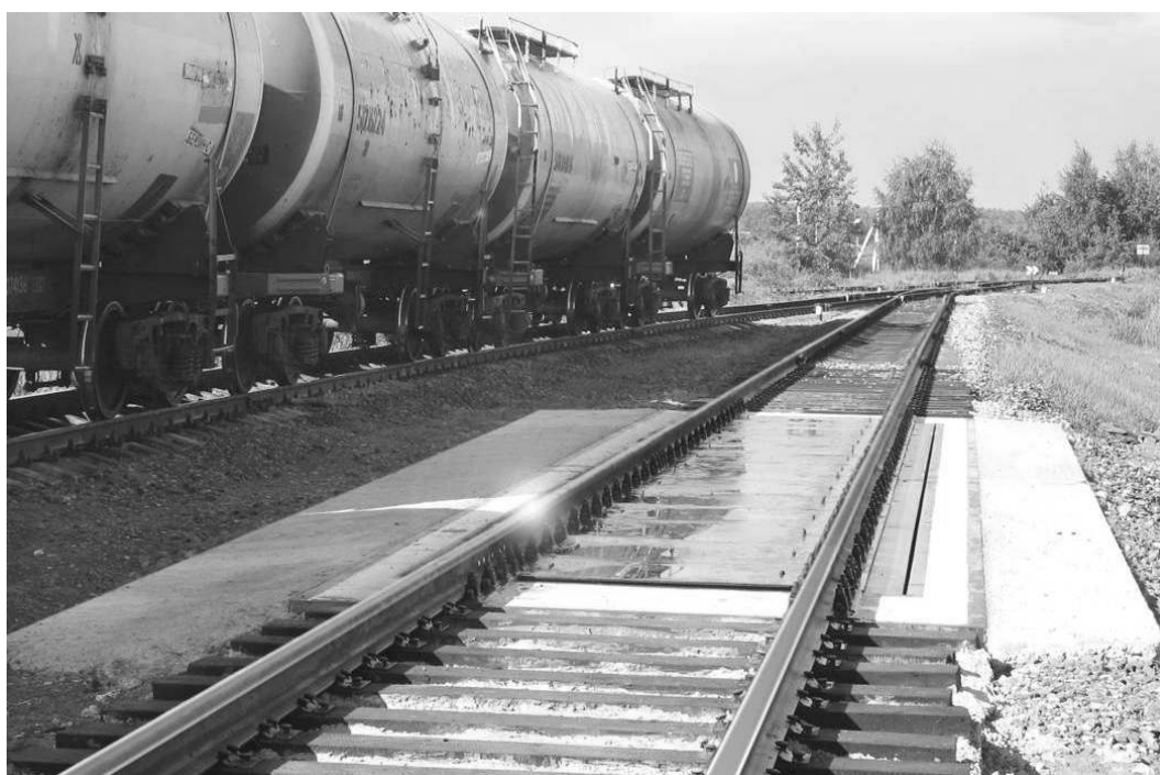
Рисунок 1 - Общий вид ГПУ весов